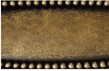
002 CUERO PLB